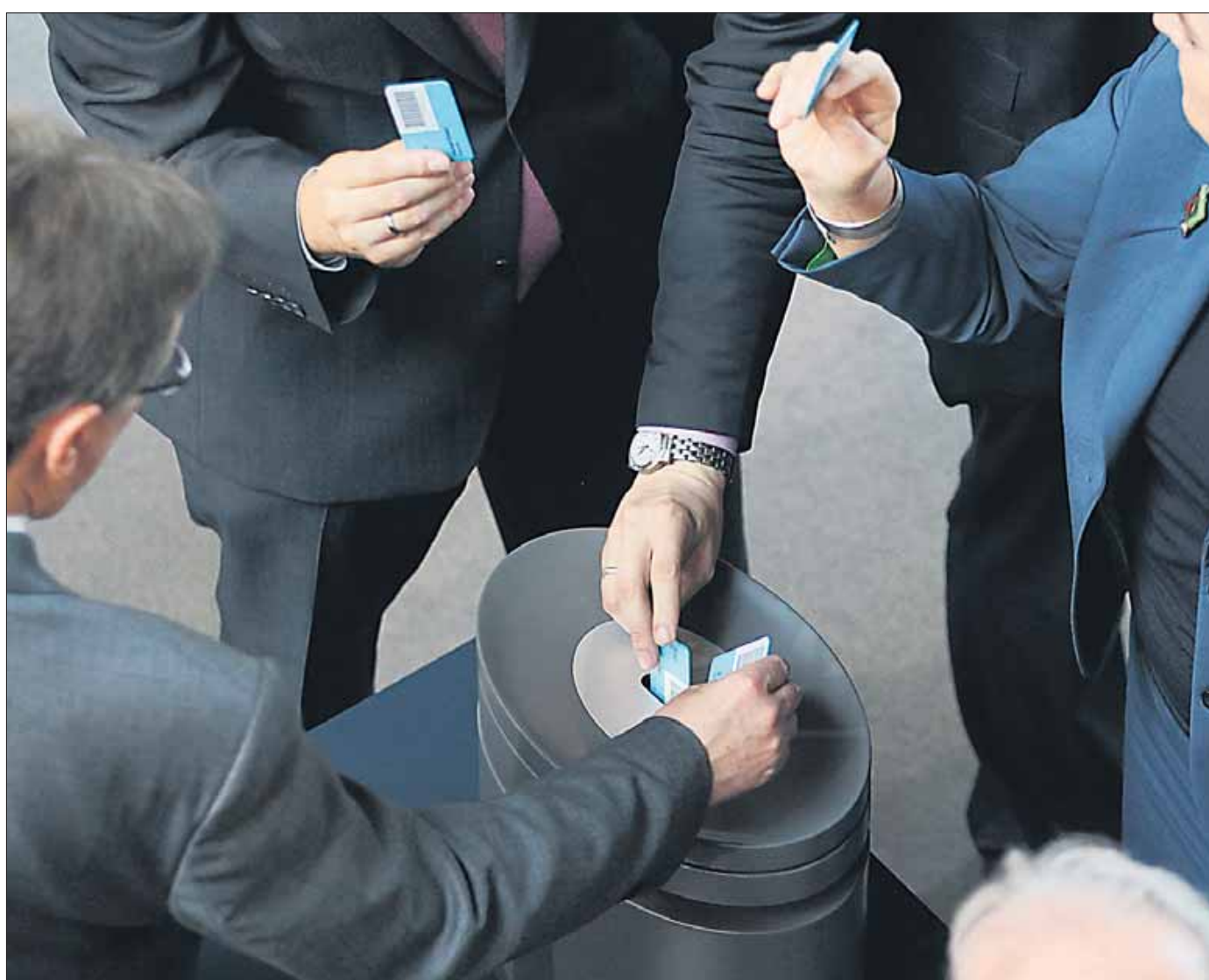
Wohin fließt das Geld? Abstimmung über den Euro-Rettungsschirm im Bundestag.

Wenn man sich die Berichterstattung über die (vermeintliche) Griechenland-Rettung durchliest, kann man eigentlich kaum glauben, dass es hier um die Rettung eines EU-Staates ging. Vielmehr hat man den Eindruck, dass es in Wirklichkeit um die (ebenfalls vermeintliche) Rettung einer in sich tief zerrissenen und abgehalfterten schwarz-gelben Regierungskoalition ging. Die Kanzlerin mag im Zeichen der Abstimmung möglicherweise ein Gefühl des Sieges verspürt haben. Die Frage ist nur, wie hoch der Preis für diesen Sieg sein wird und ob er sich