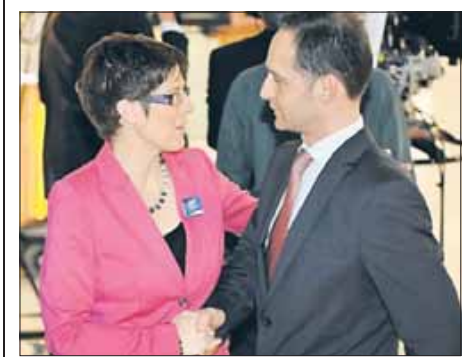
Annegret Kramp-Karrenbauer und Heiko Maas nach der Saarland-Wahl.

Heribert Prantl hat recht: Ein klares Votum hat Annegret Kramp-Karrenbauer tatsächlich erhalten: 65 Prozent der Wähler wollten sie nicht als Ministerpräsidentin („Ein Piratennest“, 26. März). Heiko Maas hat hier bessere Werte. Neben den 30,5 Prozent, die ihn direkt über die SPD wählten, wären auch 16,5 Prozent der Linken-Wähler mit einem Ministerpräsidenten Maas einverstanden, siehe das Koalitionsangebot von Oskar Lafontaine.