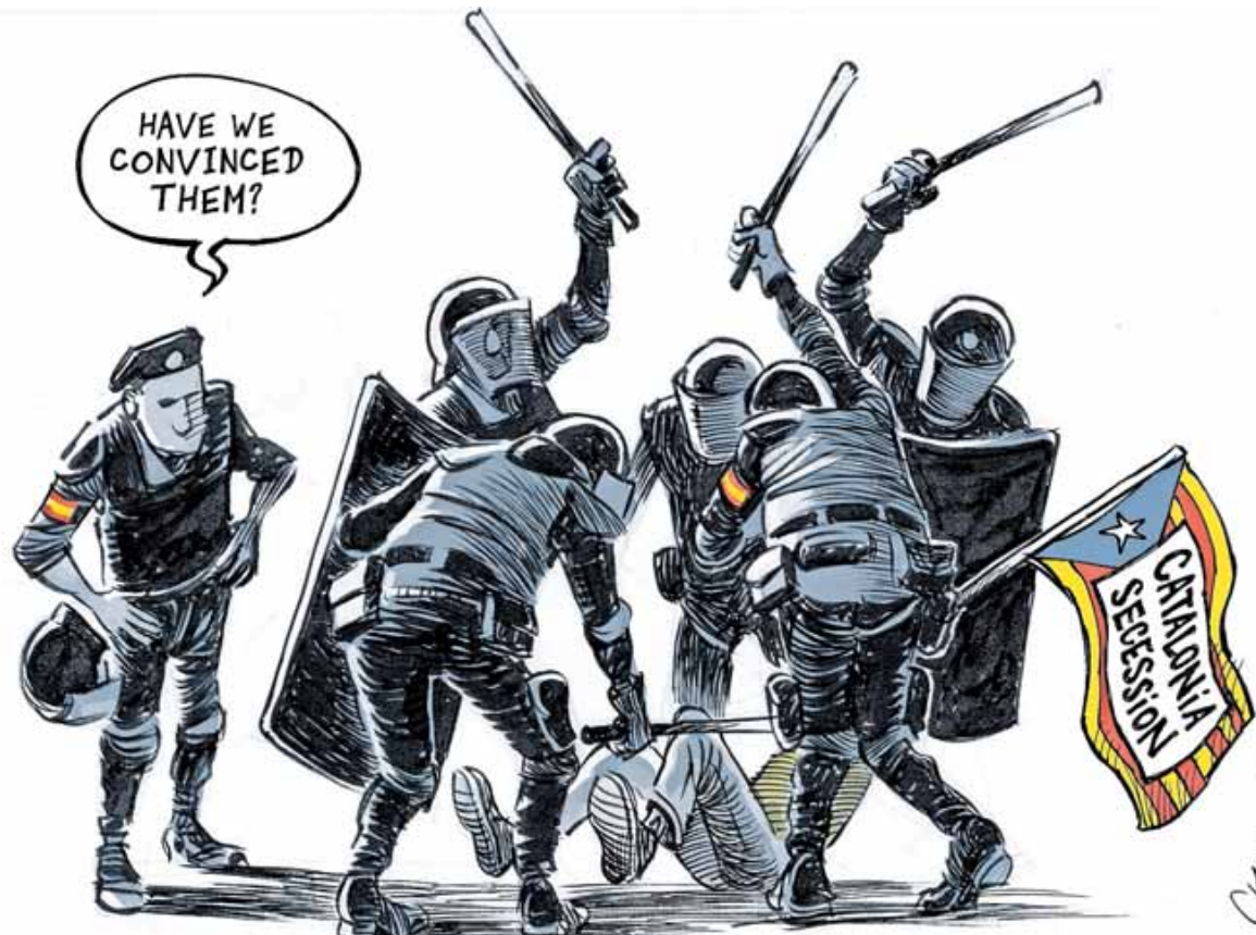
Abspaltungswilliges Katalonien: „Haben wir sie überzeugt?“